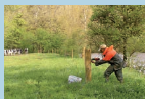
Pose de clôture en bordure de la rivière Aveyron (commune d'Olemps)