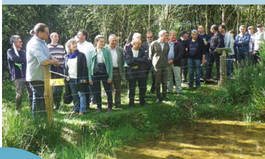
Inauguration de la zone humide de Maymac (Rignac) le 16 septembre 2015

Après avoir largement contribué à la préservation et à la mise en valeur de la zone humide de Maymac (vallée de l'Alze à Rignac), le SIAV2A s'apprête à assurer la maîtrise d'ouvrage et la coordination des travaux de restauration de la zone humide du Moulin de Castel (vallée de l'Assou à La Rouquette).